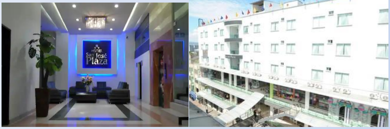
Hotel San José Plaza o similar (Bucaramanga)