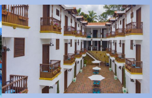
Hotel Alejandria (San Gil)