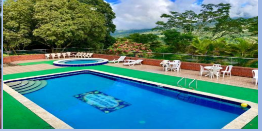
Hotel La Trinidad o similar (San Gil)